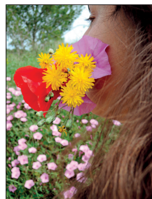
1er prix, thème : « Les couleurs »

Voici les deux images sélectionnées en premiers prix par le jury du concours organisé par « Zoom Photo Club », qui a eu lieu le 18 avril dernier sur la commune. Vous pourrez voir les oeuvres de tous les participants sur le site de l'association : https://clubphotomontarnaud.wordpress.com/infos-expos-concours/concours-photo/