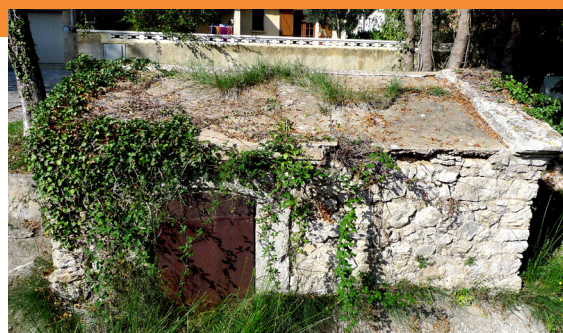
Le bâtiment avant débroussaillage