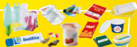
Tous les autres emballages en plastique (pots, barquettes, films, sacs, suremballages...).