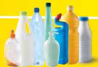
Bouteilles et flacons en plastiques Bien vidés, avec les bouchons.

Aujourd'hui, sur notre territoire, des solutions ont été trouvées pour ne pas jeter et recycler plus. De votre côté, il suffit de déposer tous vos emballages !