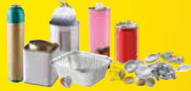
Emballages en métal, même petits.